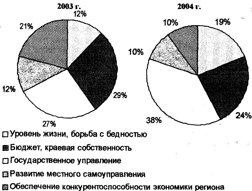
Рис. 1. Тематика правовых актов, принятых в 2003-2004 гг.

Вместе с тем на формировании повестки дня сессий краевого Совета не могли не сказаться тенденции в социально-экономическом развитии края, инициативы и нововведения со стороны Президента Российской Федерации В.В.Путина и Государственной Думы Федерального Собрания Российской Федерации (далее – Государственная Дума).