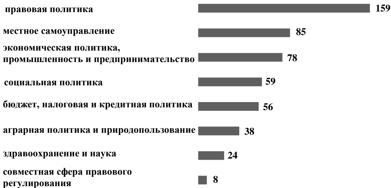
Рис. 3. Количество законов Алтайского края, принятых с декабря 2011 года по сентябрь 2016 года, в разрезе сфер правового регулирования